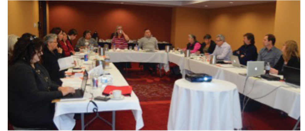
Rencontre du Conseil du réseau RCAU, Ottawa 2014

La mobilisation des connaissances demeure la priorité du secrétariat du RCAU. Le secrétariat a dévoilé un site Web mis à jour : www.uakn.org , mettant en lumière chaque projet et différentes statistiques, ainsi que les différents événements du RCAU, et l'information de chacun des Centres régionaux de recherche (CRR). Les bulletins d'information, les brochures et les résumés de recherche des dernières années se trouvent aussi dans ce site Web.