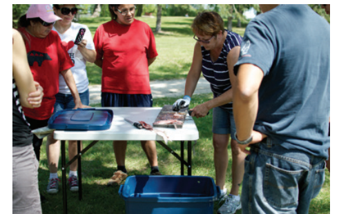
Définir la sécurité alimentaire pour les Autochtones urbains, participants à l'atelier "Fishing in the City", 2014

Impacts sur la communauté – Comme l'a mentionné un participant au groupe de discussion: « J'essaie de manger et de vivre plus sainement et de revenir à mener une bonne vie, je suis tellement heureux de m'être joint à ce groupe, lorsque j'en ai entendu parler, je me suis dit « oui ! je m'inscris ! » - Participant au groupe de discussion.